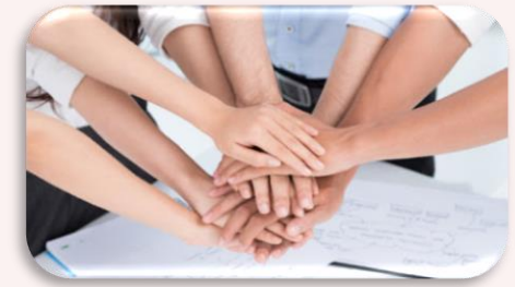
동료 및 주변인(제3자)